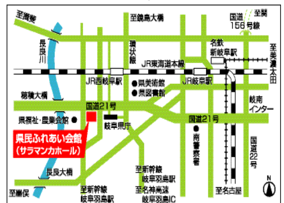
【 会場案内図 】

〒500-8507 岐阜市藪田南5-14-53 TEL 058-277-1111 URL http://www.gifu-fureai.jp/