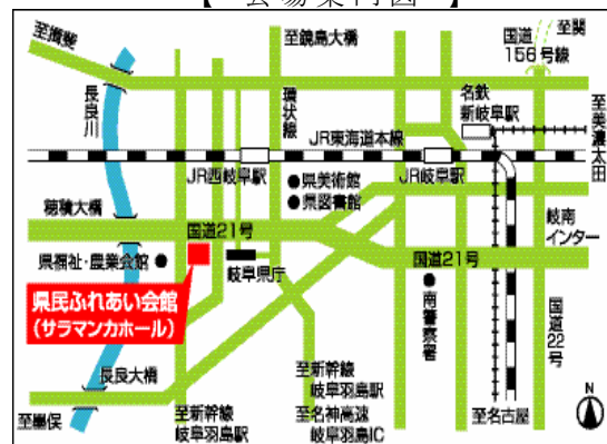
【 会場案内図 】